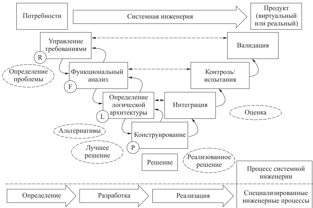
Рис. 4. Схема базовой деятельности в контексте V-процесса системной инженерии, реализованная в среде 3DExperience