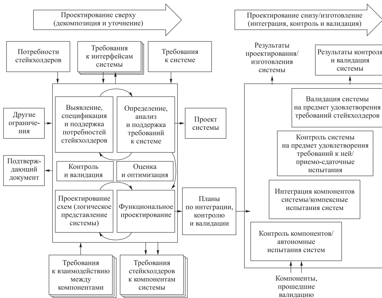
Рис. 3. Схема V-образного процесса проектирования

Согласно стандарту ISO/IEC TR 24748–1:2010 [16], для описания ЖЦ изделий используют модели как с последовательным прохождением